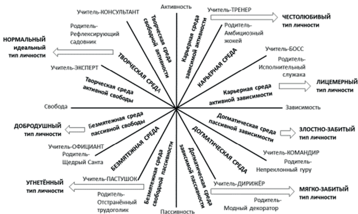
Рис. 2. Обусловленность личностно-формирующей среды педагогическими позициями наставников Fig. 2. The dependence of the personality-developing environment on the mentors' pedagogical positions

Как справедливо констатируют М. К. Алиева и Х. Х. Гаджиева, ключевым фактором формирования личности является коллективное влияние различных общественных групп и отдельных индивидов, которые образуют многогранную социальную среду [16]. Предложенная нами типология педагогических позиций наставников, обуславливающих соответствующий тип личностно-формирующей образовательной среды, комплементарна типам личности, описанным П. Ф. Лесгафтом как «школьные типы» [17] (рис. 2, таблица).