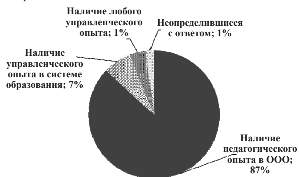
Рис. 1. Распределение ответов респондентов о необходимости для современного управленца опыта педагогической или управленческой деятельности

Полученные нами результаты представлены на рис. 1.