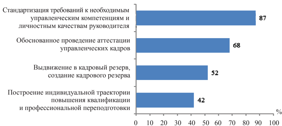
Рис. 4. Распределение ответов респондентов по выявлению приоритетности ожиданий в отношении значимости составляющих от внедрения профессионального стандарта руководителя общеобразовательной организации

Для того чтобы выяснить ожидания руководителей ООО от внедрения профессионального стандарта, им было предложено ранжировать по убыванию значимости четыре составляющие. Полученные результаты представлены на рис. 4.