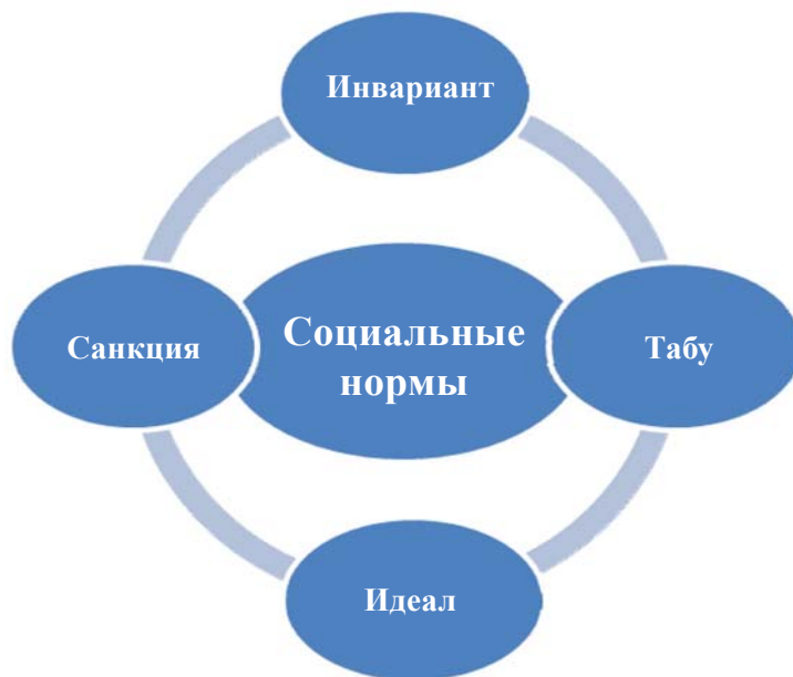
Компонентный состав социальной нормы

При этом личность сама выстраивает смысловые границы понимания норм, проецируя их в свое интрапсихическое пространство. Соответственно, возникает вопрос о субъектности личности, личностной ответственности, ответственной участии личности (по М. М. Бахтину). М. М. Бахтин совершенно справедливо отмечает наличие у личности двух базовых миров: объективного единства культурной области и неповторимой единственности переживаемой жизни, которые устанавливают двухстороннюю ответственность и за свое содержание (специальная ответственность) и за свое бытие (нравственная ответственность) [14].