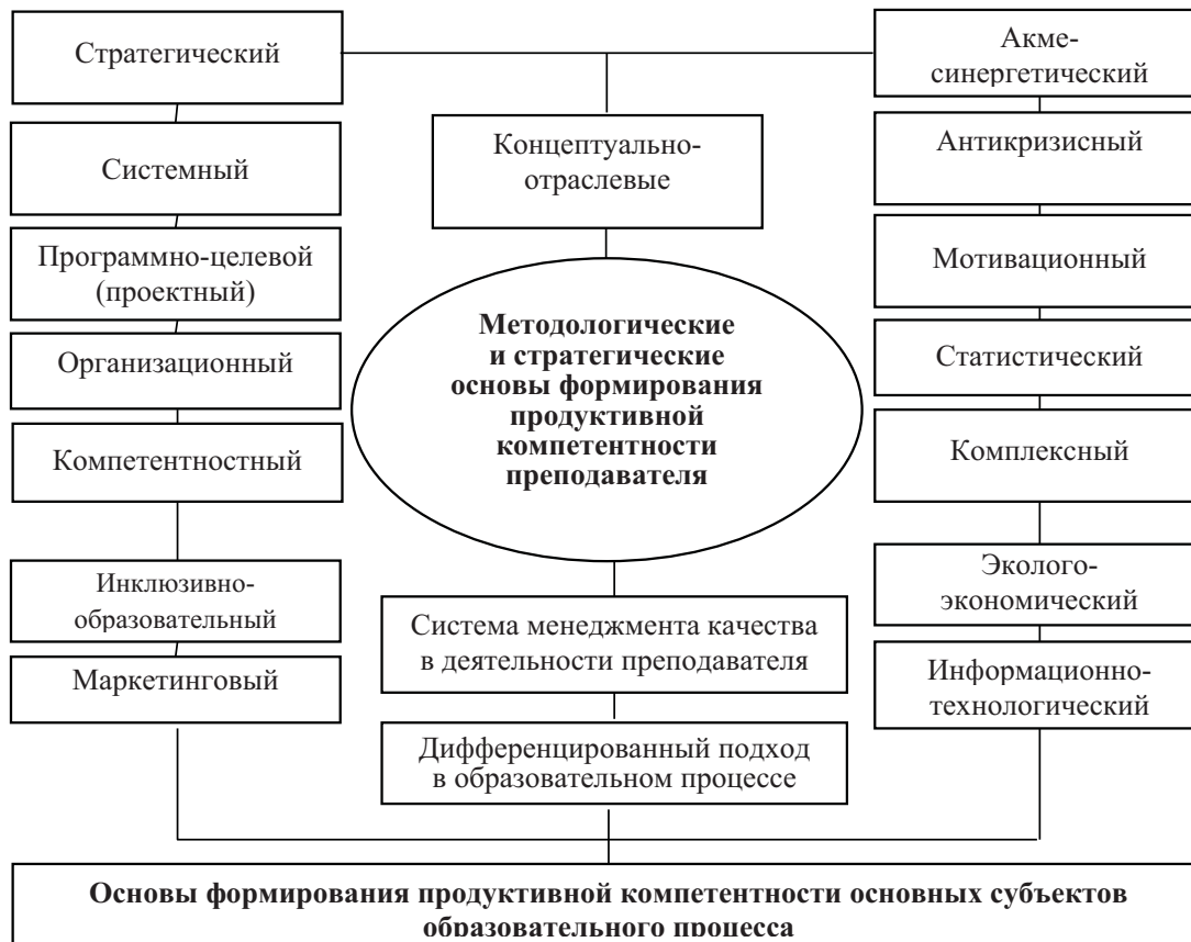
Рис. 1. Основы формирования профессиональной компетентности преподавателя