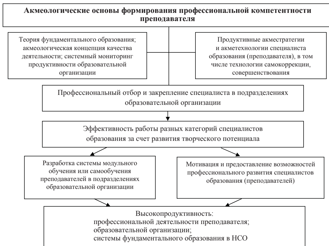
Рис. 3. Формирование профессиональной продуктивности преподавателя Fig. 3. Acmeological basis for the formation of teacher's productivity

Основой формирования профессиональной продуктивной компетентности преподавателя являются акмеологическая теория фундаментального образования и акмеологическая концепция качества профессиональной деятельности (рис. 3). Главными признаками продуктивной компетентности преподавателя, в отличие от репродуктивной, являются: