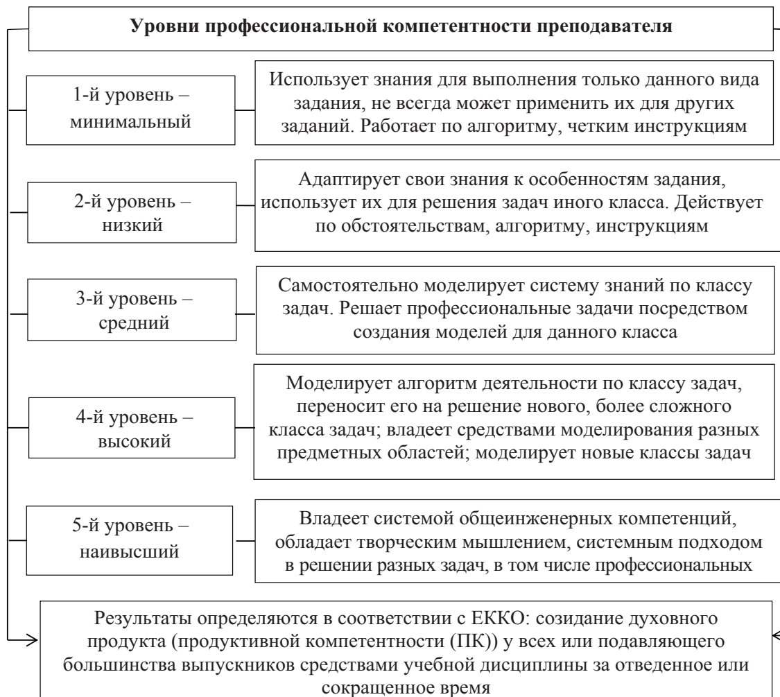
Рис. 2. Многоуровневая система профессиональной компетентности преподавателя

Для определения сформированности профессиональной компетентности с опорой на акмеологическую концепцию развития профессиональной компетентности в вузе [19, с. 54–69] разработана и наглядно представлена классификация уровней ее продуктивности (рис. 2).